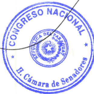
Silvio Ovelar B. Presidente H. Cámara de Senadores